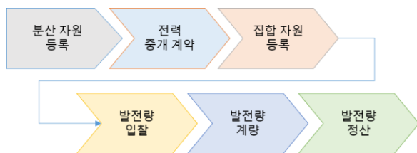
그림 2 전력중개 프로세스

전력중개시스템의 비즈니스로직 설계를 위한 전력중개 프로세스는 그림 2 와 같다. 먼저, 발전사업자는 전력중개시장에 분산자원을 등록한다. 발전사업자는 등록된 분산자원의 발전전력에 대한 판매 권한을 중개사업자에게 위임하거나 분산자원 유지보수 등의 부가서비스를 제공받기 위하여 전력중개사업자와 중개계약을 체결한다. 전력중개사업자는 계약 체결한 분산자원들을 집합자원화하여 전력중개시장에 등록하고 등록된 집합자원의 발전량을 예측하여 발전량 입찰에 참가한다. 전력중개시스템은 계약 체결된 집합자원의 발전량 데이터를 계측 및 기록하고 시간대별 전력 가격 및 인센티브 등을 고려하여 집합자원의 발전전력에 대한 판매 수익을 정산한다.